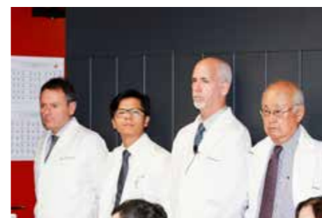
明海大学歯学部生涯研修部